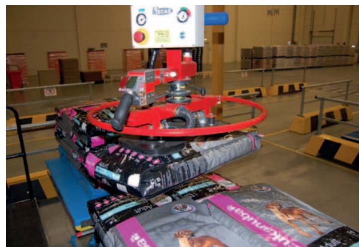
De magnetische gripper bij de afstapelininstallatie van Procter & Gamble.