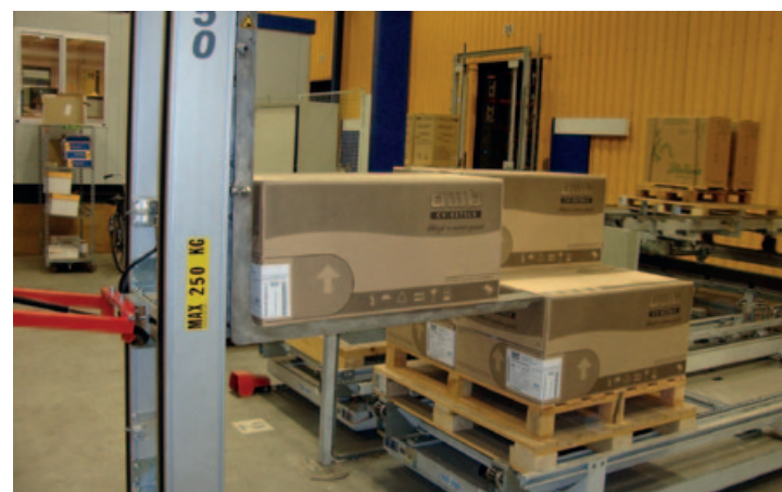
Volautomatische ondersteuning bij het stapelen van producten op een pallet.

Tientallen zakken van ieder twintig kilo met diervoeder afpakken en ompakken naar een pallet. Ga er maar aanstaan met twee man. Het is vragen om rugproblemen met het risico op langdurig ziekteverzuim. Een tilhelpinstallatie zou kunnen helpen om tot een meer ergonomische en efficiënte handling van (middel)zware goederen te komen.